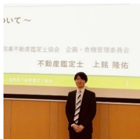
福岡県不動産鑑定士協会 講師