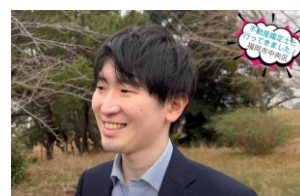
福岡県不動産鑑定士協会 YouTube