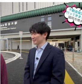
福岡県不動産鑑定士協会 YouTube